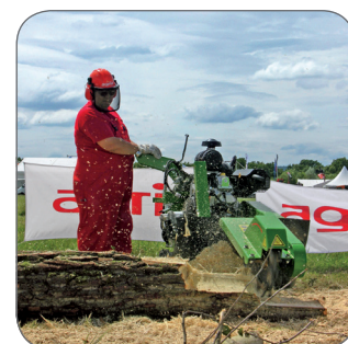
Vollautomatisches Arbeiten unter Überwachung